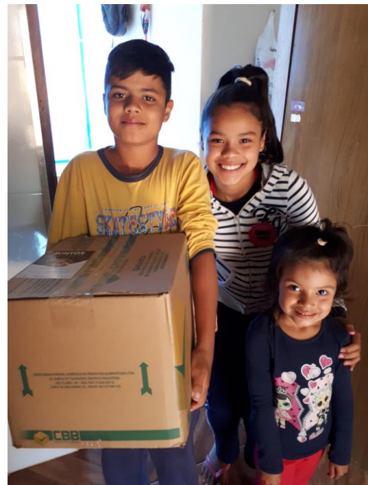
Entrega de Cestas Básicas

Rua Taquarituba, 245 – Jardim Espanha – Itaberá/SP – CEP: 18440-000 (15) 3562-1163 – nucleodeitabera.apso@ucb.org.br