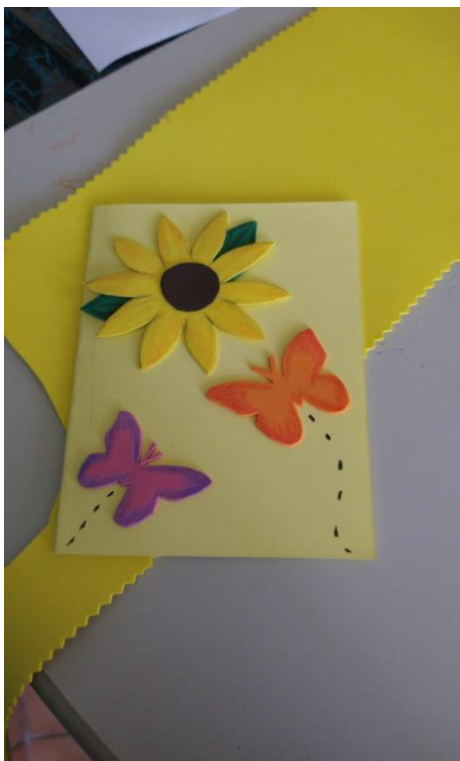
Confecção Cartões de Primavera