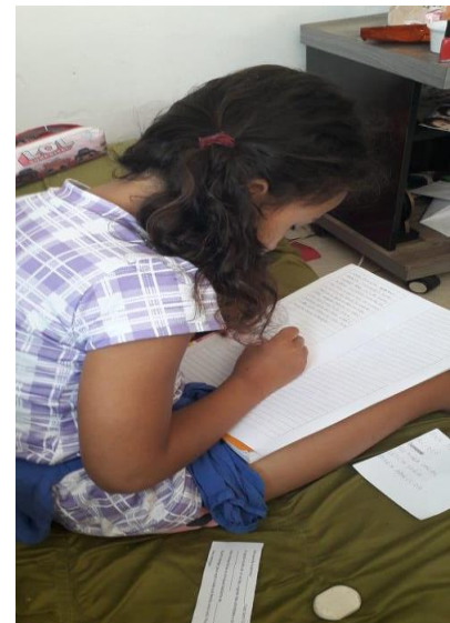
Atividades de escrever em casa