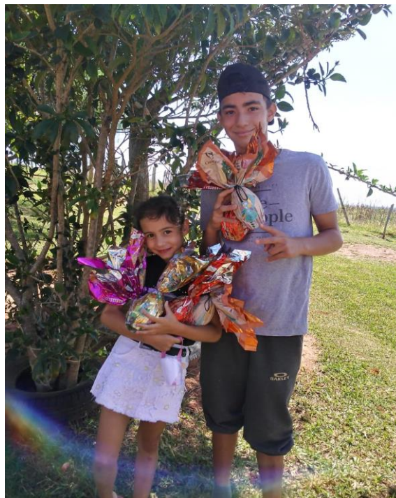
Entrega dos ovos de Páscoa