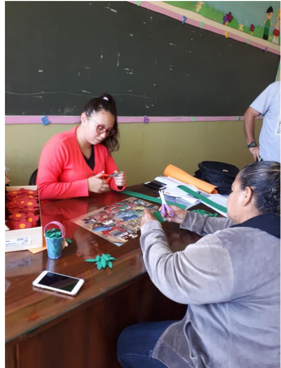
Trabalhos Artístico: Confeção das lembrancinhas