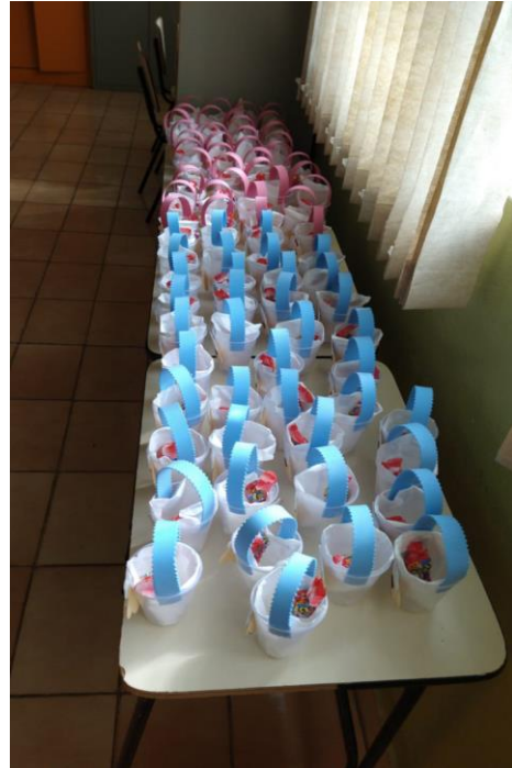
Lembrancinhas de Páscoa