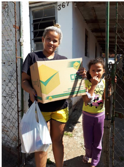
Entrega de Cestas Básicas

Rua Taquarituba, 245 – Jardim Espanha – Itaberá/SP – CEP: 18440-000 (15) 3562-1163 – nucleodeitabera.apso@ucb.org.br