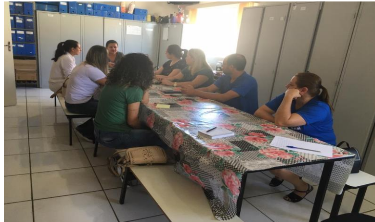
Reunião de Capacitação