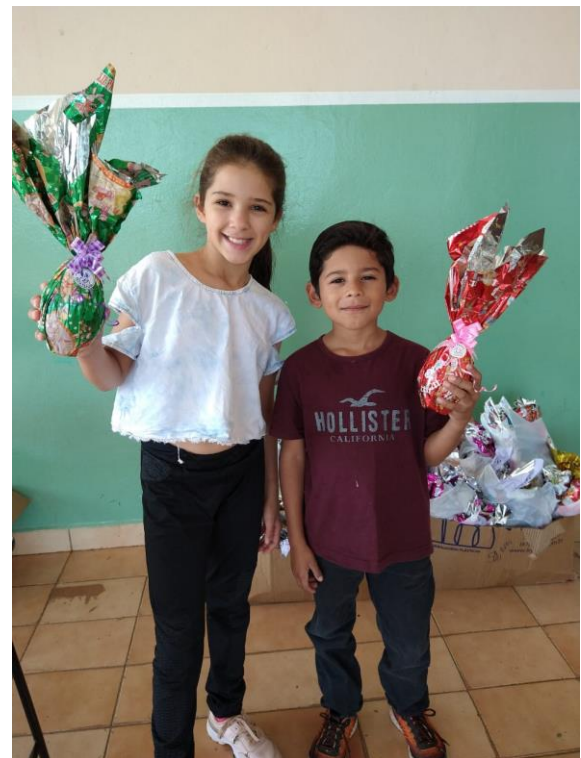
Entrega dos ovos de Páscoa