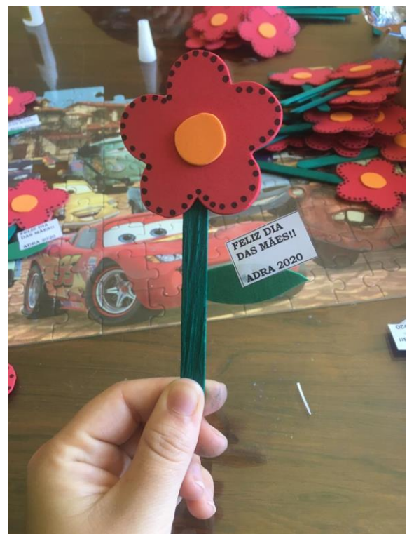
Confecção Lembrancinhas para o dia das mães