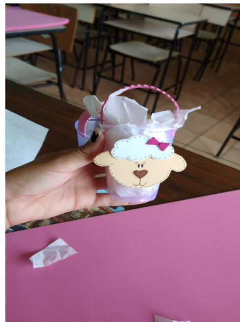
Lembrancinhas de Páscoa