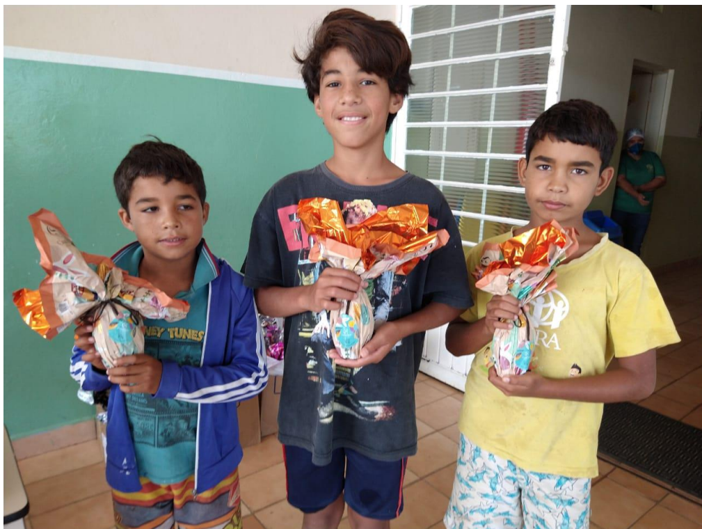
Entrega dos ovos de Páscoa

Rua Taquarituba, 245 – Jardim Espanha – Itaberá/SP – CEP: 18440-000 (15) 3562-1163 – nucleodeitabera.apso@ucb.org.br