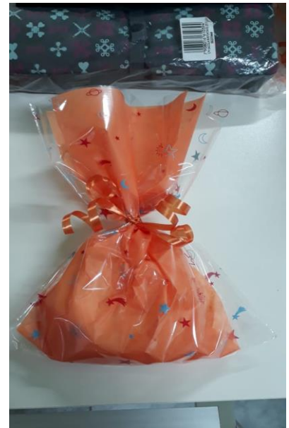
Confecção Lembrancinhas para o dia das mães