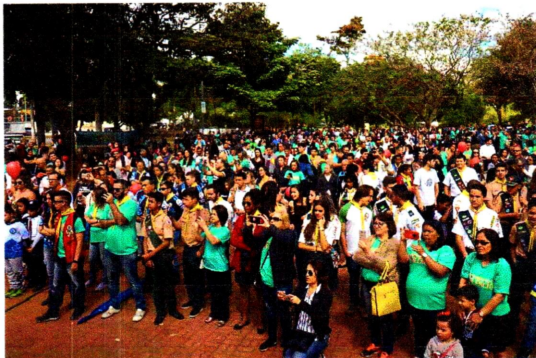
Projeto Identidade: Profissional de Enfermagem