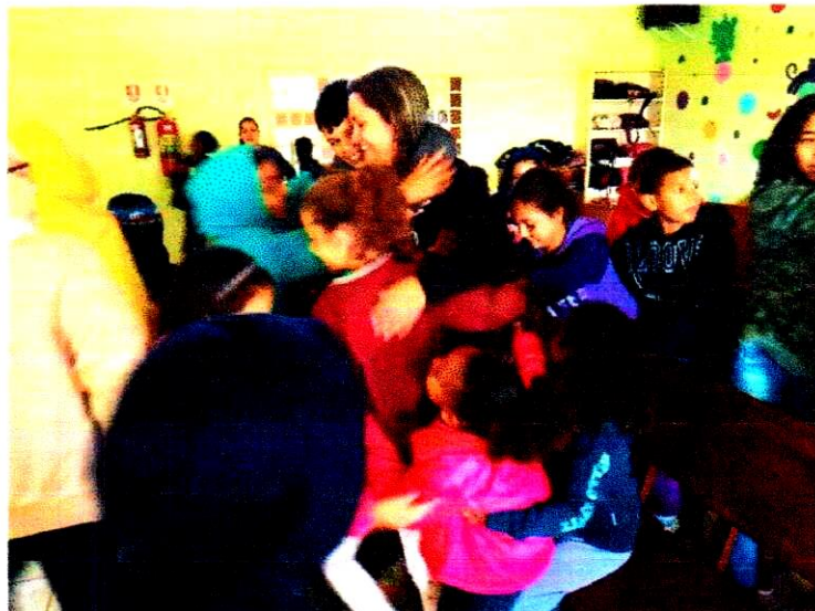
Reunião de Pais